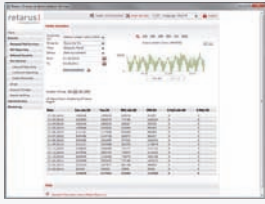
Extensos informes de fax proporcionan información detallada sobre cada tarea realizada