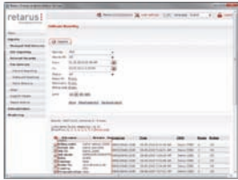
Transparencia y control gracias a estadísticas de gran valor informativo