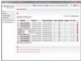
Monitorización en directo de los documentos de fax en proceso de envío