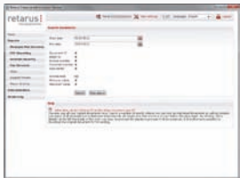
Búsqueda amplia y rápida