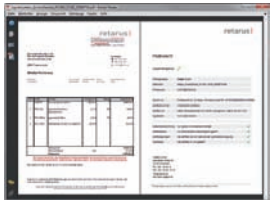
Comprobación sencilla de firmas electrónicas con el Adobe Reader