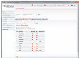
Configuration simple en utilisant des catégories