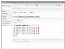
Suivi de l'utilisation d'Internet grâce aux profils