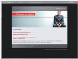
Protection fiable contre les contenus indésirables