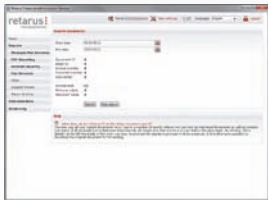
Recherche rapide et complète