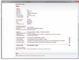
Toutes les informations en un coup d'œil