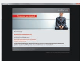
Protezione affidabile da contenuti indesiderati