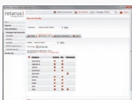
Comoda configurazione tramite categorie