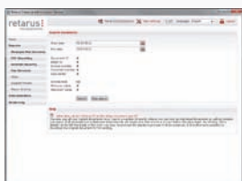
Ricerca veloce e dettagliata