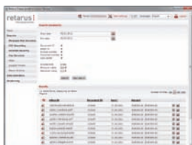
Comoda verifica della firma elettronica in Adobe Reader.