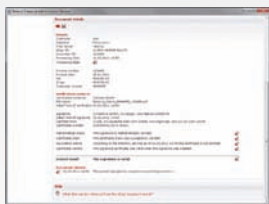
Tutte le informazioni di rilievo sotto controllo